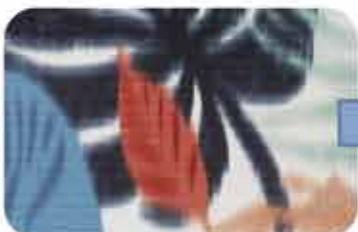
Antes de la corrección de la alimentación

FeedMaster realizará un ajuste automático de la alimentación del papel a través del sensor de color incorporado. Esta función inteligente reducirá los residuos y aumentará la eficiencia.