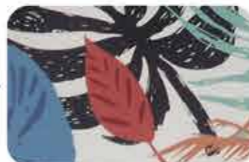
Después de la corrección de la alimentación