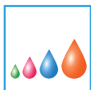
Piezo Variable Drop